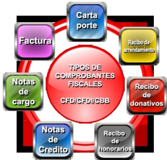
Imagen 1. Tipos de comprobantes fiscales

proveedor), será un ingreso o egreso, por ejemplo en la postura del cliente: una factura soporta el egreso o gasto realizado por la adquisición de un producto o servicio.